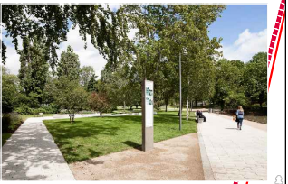
Informacinio stendo analogas