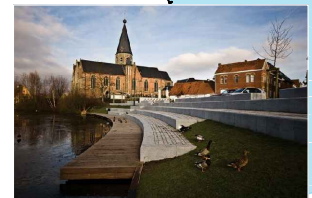
Pakrantės sutvarkymo analogas